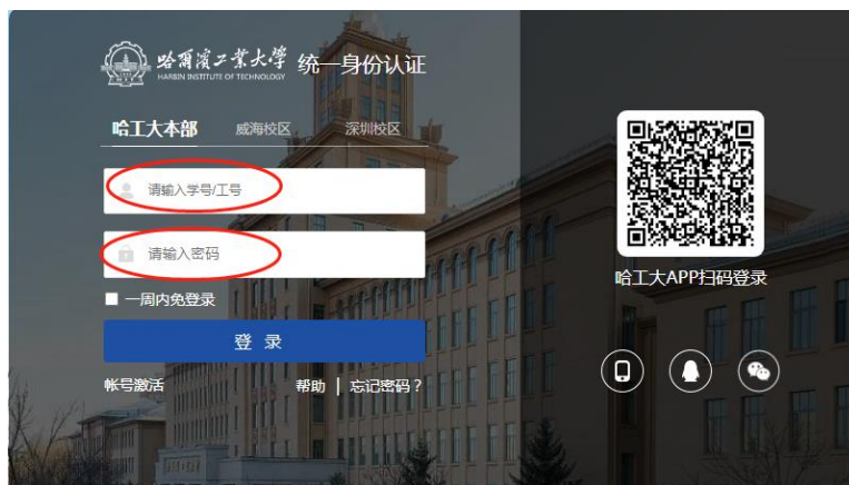
图 3：以“统一身份认证”方式登录

3. 在“统一身份认证”系统登录页中，输入正确的用户名（本人学号）、密码（本人统一身份认证密码），最后点击“登录”按钮即可进入平台。如图 3：