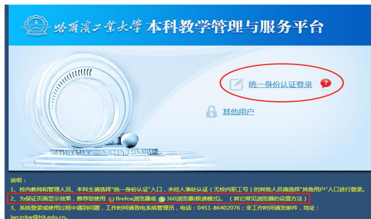
图 2：点击“统一身份认证登录”