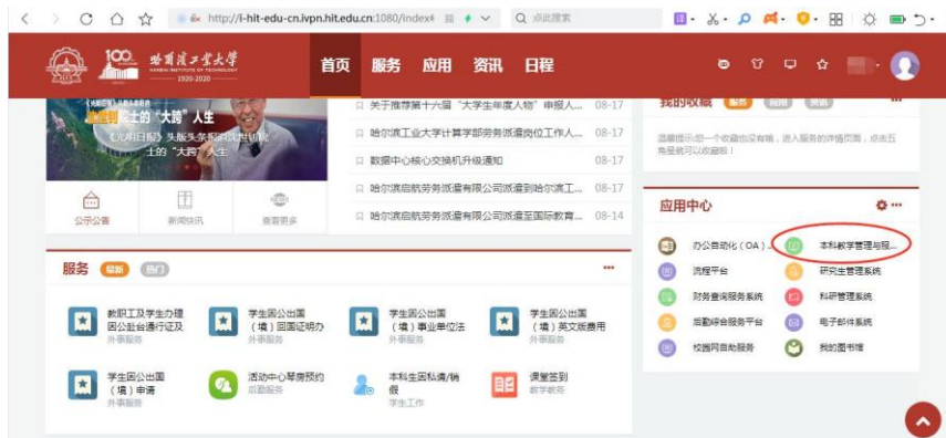
图 1：在校园门户找到本科教学管理与服务平台

通过 VPN 系统进入校园门户后，在右下角的“应用中心”区域中，点击“本科教学管理与服务平台”链接（如图 1），然后请阅读第 2 步。