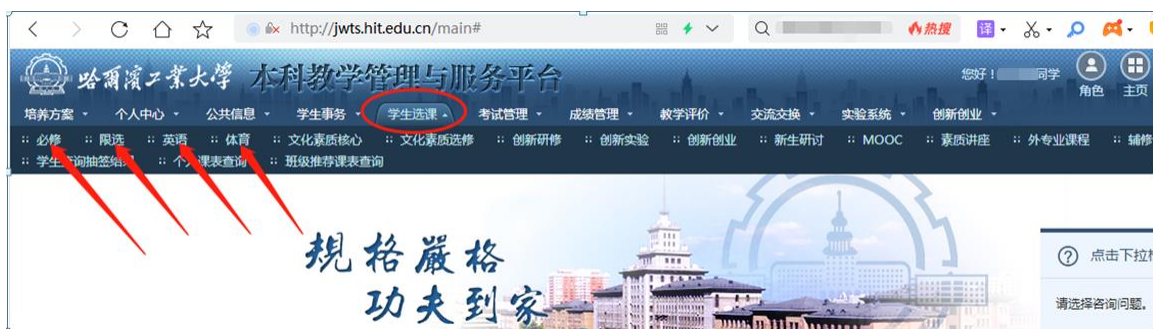
图 4：点击菜单进入不同课程的选课页面

4. 进入平台后，点击主选单中的“学生选课”，然后根据需要选择的课程类别点击不同的二级选单（如“体育”）即进入选课页面，如图 4；在“备选课程”页面中点击“查询”按钮，平台将列出可选课程，在要选择的课程前点击“选课”按钮即可。如图 5：